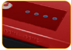
• 4 Betriebsanzeige