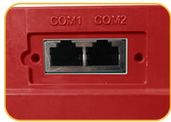
• Terminal Kommunikation Schnittstelle